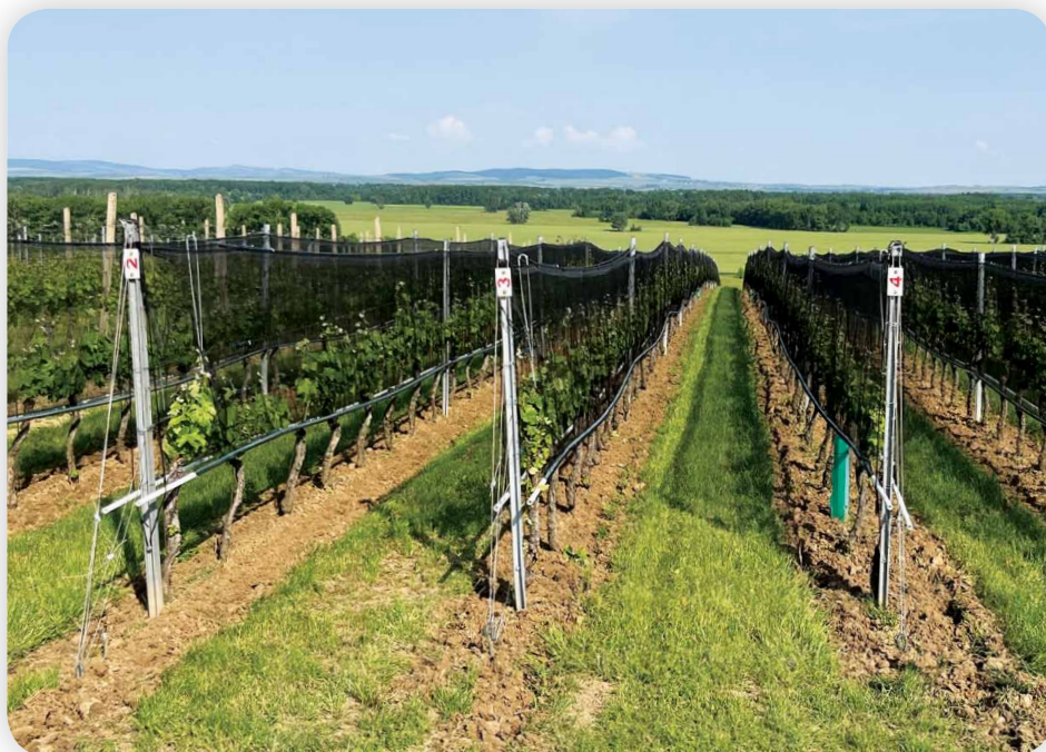
Vinice Stará hora se síťovým systémem Whailex.

le kolem 9.–10. hodiny, tedy při vyšších teplotách již bez ranní rosy. Sesbírané hrozny dopravím do vinařství ke zpracování za pouhých 15 minut. Nejdůležitější změnou, kterou jsem u Cabernetu Sauvignon zavedl, je ta, že jsem před 20 lety přestal mlít hrozny a používám pouze odstokování. Cabernet má totiž vyšší podíl třapin, a pokud ty se poškodí, dostávají se do vína nežádoucí zelené tóny, které se velmi těžko odstraní, pokud vůbec. To mi