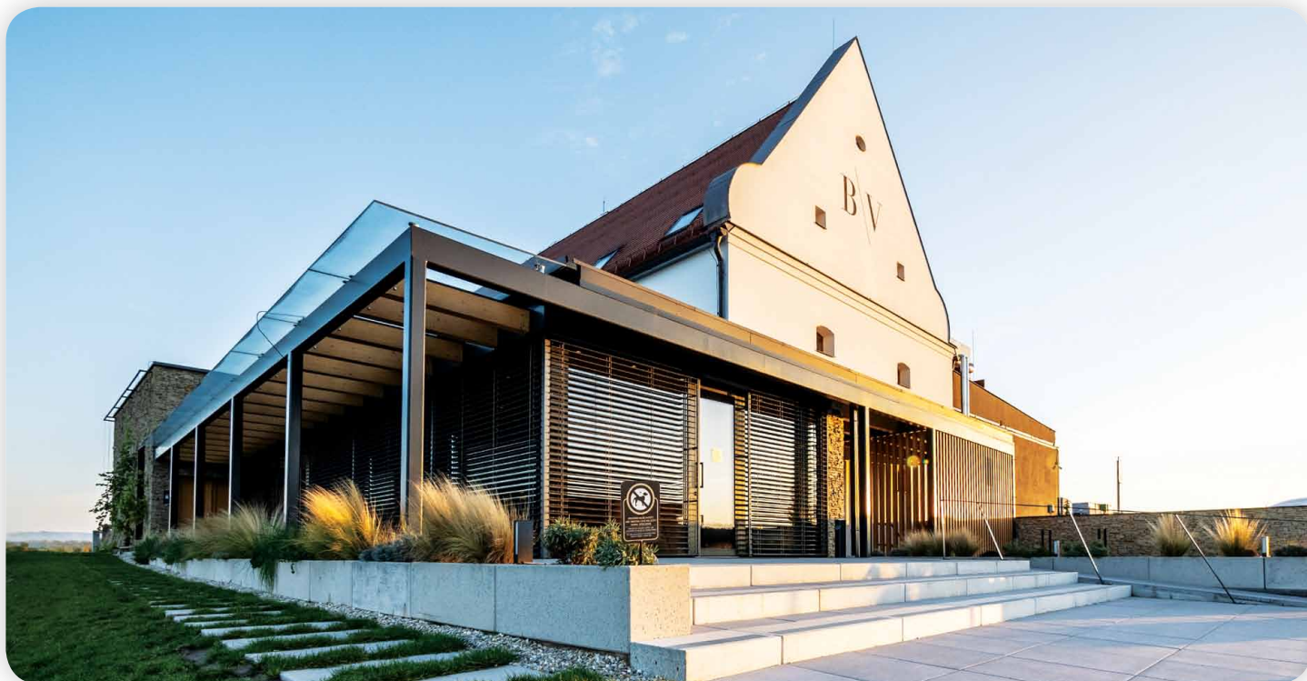
Moderní vinařský areál B\ V vinařství najdete v Miloticích.

v Novém světě, kde dává koncentrovaná vína s tóny mnohdy přezrálého černého ovoce a nových barikových sudů. V České republice byla tato pozdě dozrávající odrůda zapsána do Státní odrůdové knihy v roce 1980. Zastoupena je výlučně v oblasti Morava s převážným výskytem v Mikulovské a Velkopavlovické podoblasti. V současnosti se Cabernet Sauvignon pěstuje na ploše 225 hektarů, což představuje 1,27% z celkové rozlohy vinic. Hlavní příčina nízkých výsadeb tkví v náročnosti odrůdy na teplo a polohu. Postupná změna klimatu jí však prospívá. Projevuje se to vzrůstajícím počtem vinařů, kteří se odrůdou zabývají a vyrábí z ní jak jednodrůdová vína, tak i cuvée podstupující zrání v různých typech sudů.