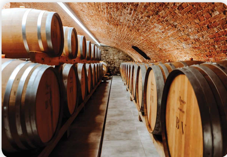
Zrání v barikových sudech tvoří nedílnou součást osobitého stylu vín.

řadách nevznikají každý rok. Zástupci těchto řad získávají každoročně vysoká ocenění na mezinárodních soutěžích, které slouží jako benchmark v kontextu mezinárodní konkurence. Maximální soustředění na kvalitu se projevilo v posledním vydání Průvodce, kde červená vína z řad Reserva dosáhla na excelentní ohodnocení. Nejúspěšnějším vzorkem vinařství se stal Cabernet Sauvignon 2018, výběr z hroznů, Krumvíř, Nivy z řady Reserva, který s 97 body