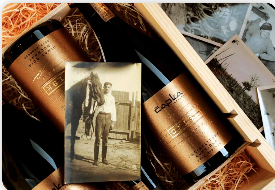
Řada Otisk v sobě odráží více než 200letou tradici výroby vína.

Pro Cabernet Sauvignon používáme jedno bednářství, Tonnellerie Quintessence, které sídlí v Bordeaux, slavné apelaci, kde má Cabernet Sauvignon nezastupitelné postavení a tradici. Používáme dvě varianty sudů. Cabernet z ročníku 2021 zrál 18 měsíců v 500litrových sudech prvního plnění se stupněm vypálení medium plus. Zde byla od začátku krásně vidět souhra sudu